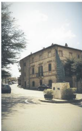
Borgo Garibaldi - Partenza