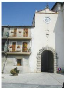
Ingresso Centro Storico (arrivo)