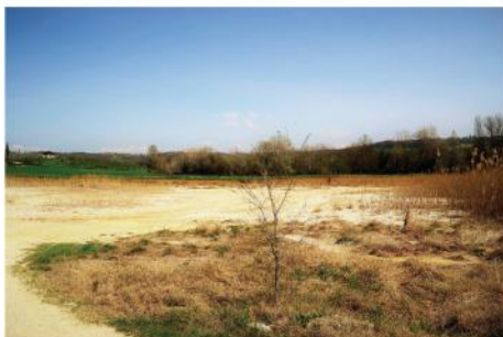
Solfatarà (punto di ristoro intermedio)

Per i soci FIASP l'iscrizione è ridotta di € 0,50