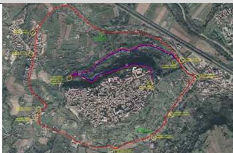
Gara Podistica "Ottobrata Orvietana"

Premio speciale per chi migliora il proprio personale stabilito nelle precedenti edizioni dell'"Ottobrata Orvietana"